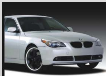
Osobní vozy a SUV